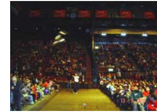
Preparado por Gustavo Di Si - “El Alma del Piloto”

Kites can be flown windless indoor or outdoor ; the flyers can generate enough lift simply by moving opposite to the kite. As similar follows rules to those for outdoor with some modifications